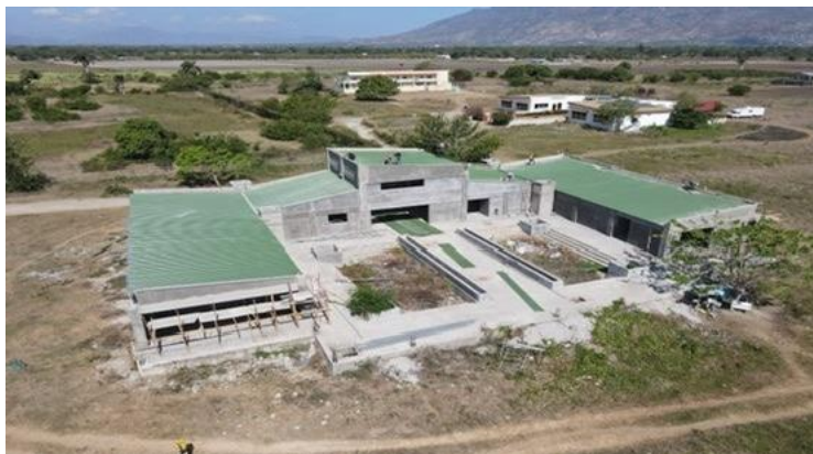
Vue aérienne de la construction du Centre de santé ambulatoire.

Les statistiques nous laissent pantois. Haïti et la Guyane se disputent la première place pour les décès dus à l'infarctus du myocarde. Haïti est le seul pays au monde à détenir la première place pour la mortalité des femmes atteintes d'un cancer du col de l'utérus. Le taux avoisine les 100 % une fois le diagnostic posé. Cela donne à réfléchir quand on sait que cette maladie peut être éliminée grâce à l'utilisation généralisée d'un vaccin.